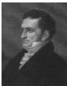
Marc Gaspar Itard

Pierre Faure construyó su propuesta de educación personalizada siguiendo con las teorías propias de la escuela pedagógica de Itard, Seguin, y María Montessori. De acuerdo con la pedagogía de Seguin, Faure diferenciaba la educación motriz, de la educación sensorial y consideraba esencial trabajar ambas junto a la educación intelectual.